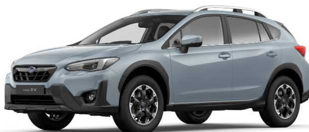
Cool Grey Khaki