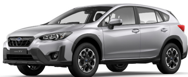
Ice Silver Metallic