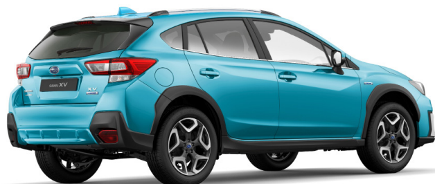
Lagoon Blue Pearl